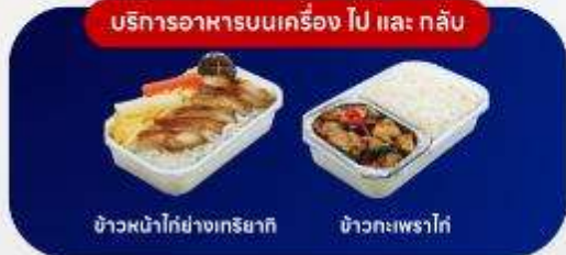
บริการอาหารบนเครื่อง ไป และ กลับ