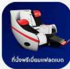
ที่นั่งพรีเมียมฟเลกซ์